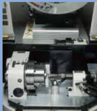
オーダーメイドの専用治具

BBT-40 tool holder used for heavy cutting.