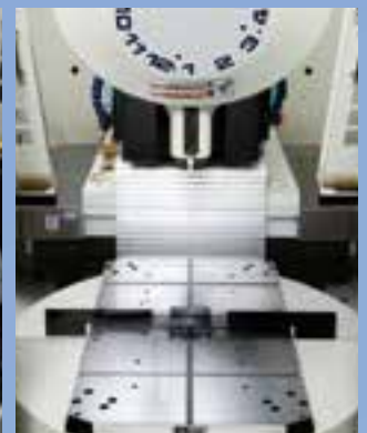
アイドルタイムゼロのツインターンテーブル